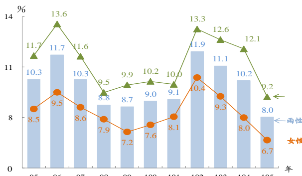
兩性受僱者工時過長比率 ①